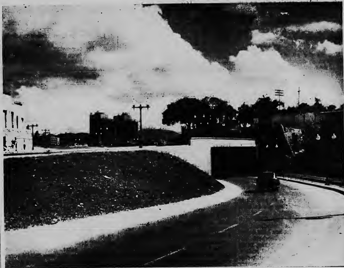
Aki nos ta mira AVENIDA "SUCRE — URDANETA", cual ta un pida di e aotapista di La Guaira — Caracas, Venezuela, cual a worde inaugurá na December anja pasa. E avehida ta carga nomber di dos herbenan di Venezuela.

Como e pasanan di Brion y e comentarista di Charla Deportiva a tuma lugar nos no ta hanja necesario pa duna detalladamente den e articulo aki, pero nos ta dispuesto pa duna cualquier informacion na esnan interesado. E punto di mas principal ta cu for di e hungador aki cu semper ta comporta malu riba tereno a mira su dificultad of a mira cu e tabata robes den e caso aki y kier a rectificá su error dilante di tur e instantenan na cual e ta hanje culpable. Nos ta comprende cu tur nos fanaticonan a sinta ansioso na nan radio of sperando nan courant dia Luna mainta pa mira kiko ta e comentario cu lo tin contra di e hungador aki. No pa nan mira asina tanto si e comentarista of periodista deportivo ta cumpli cu su deber, pero pa satisfice nan mes di tin mas di por comenta contra